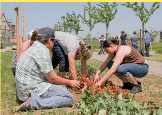
Schülerinnen und Schüler der Staatlichen Berufsschule für Gärtner und Floristen pflanzten in Burgweinting ein über 300 m langes Blumenband.