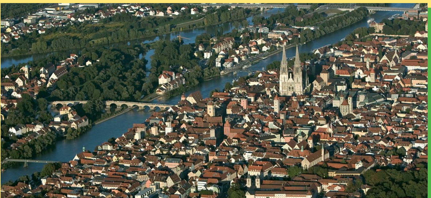
Regensburg die Steinerne Stadt ist „grüner“ als man denkt

Der Bundeswettbewerb fand im Jahr 2001 erstmals statt und wird jährlich neu ausgeschrieben. Eine mit Gold ausgezeichnete Stadt vertritt die Bundesrepublik Deutschland im Folgejahr beim Europawettbewerb „Entente Florale“. Der Bundeswettbewerb „Unsere Stadt blüht auf“ ist eine Initiative der vier Träger Zentralverband Gartenbau e. V. (ZVG), Deutscher Städtetag, Deutscher Städte- und Gemeindebund sowie Deutscher Tourismusverband e. V. Weitere Informationen: unter www.entente-florale-deutschland.de . Der Bundeswettbewerb im Internet - www.regensburg.de/regensburg_bluht_auf/