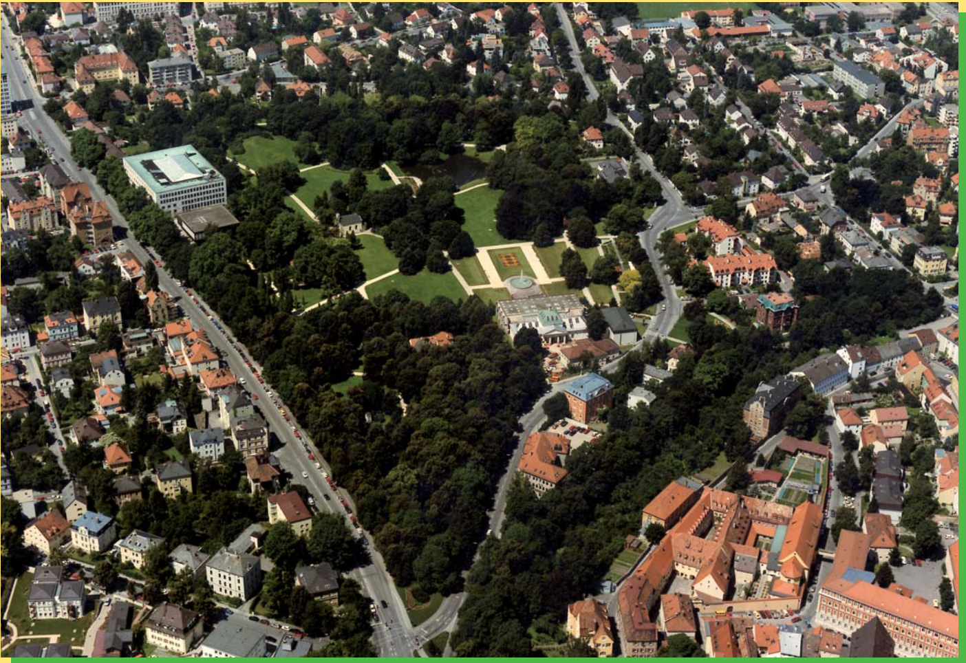
Am Rande des Stadtzentrums treffen sich die Menschen im Stadtpark gern zum fröhlichen Miteinander beim Picknicken, Sonnenbaden und Bocciaspielen.