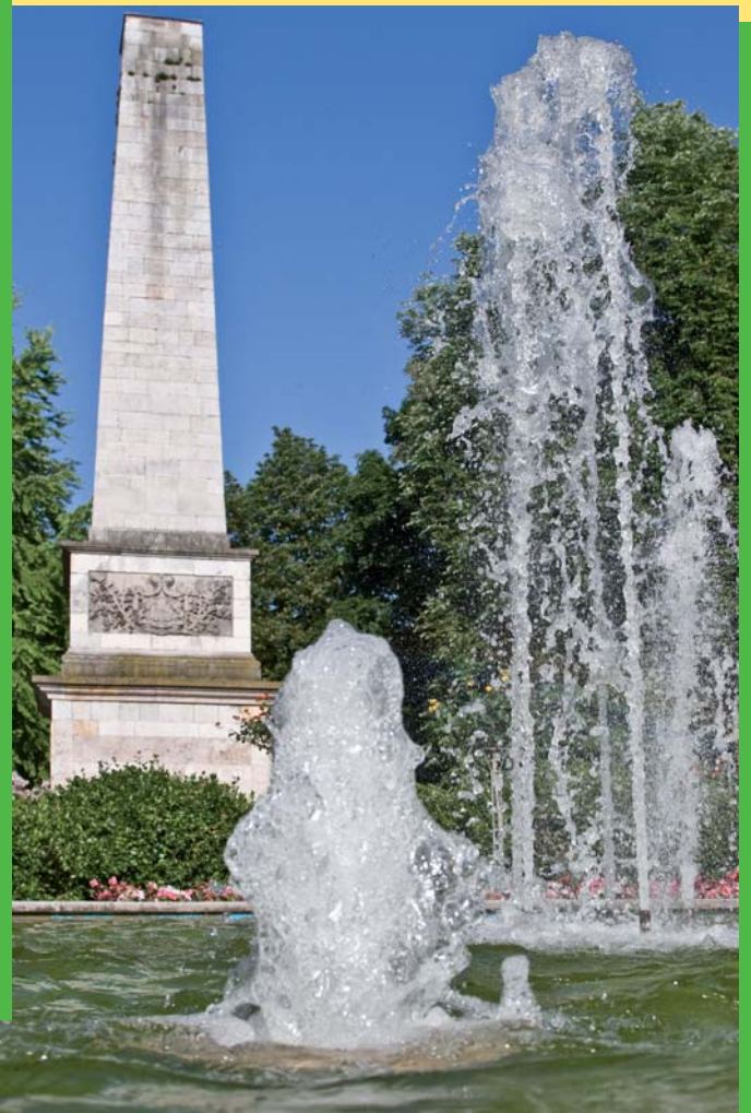
Wasserspiele in der Fürst-Anselm-Allee bieten Erfrischung und Entspannung mitten im Trubel der Stadt.