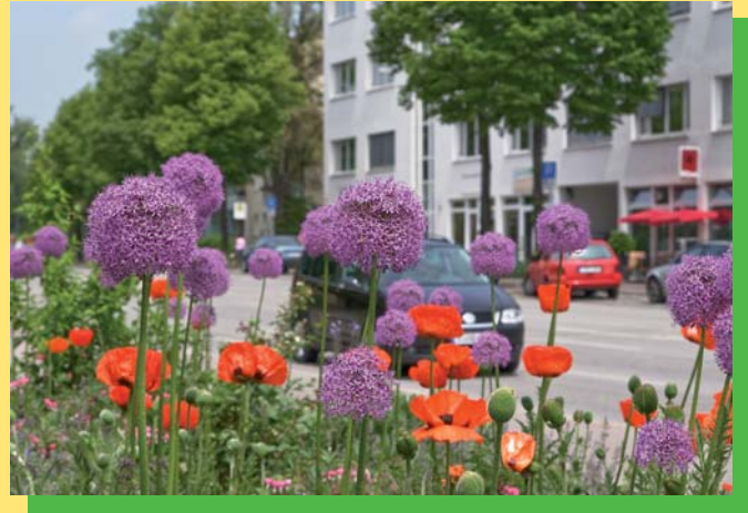
Staudenbeete an Kreuzungen, Verkehrsinseln und Fahrbahnteilern bieten ein buntes Kontrastprogramm zum Einheitsgrün.