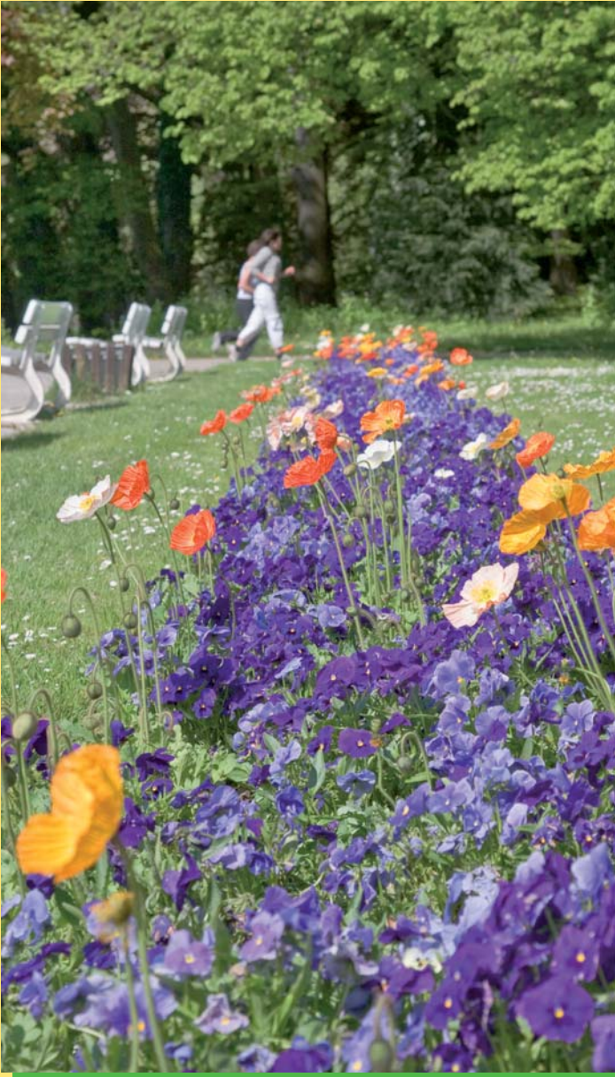
Herrliche Blumenbänder duften entlang der Wege im Stadtpark.