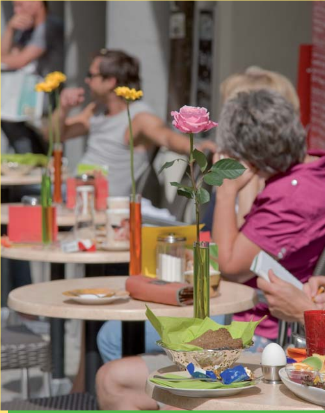
Rosen für die Altstadt, die Dritte: Platz für eine Rose ist überall, sogar auf einem Frühstückstischchen, wie hier in einem Straßenkaffee in der Gesandtenstraße.