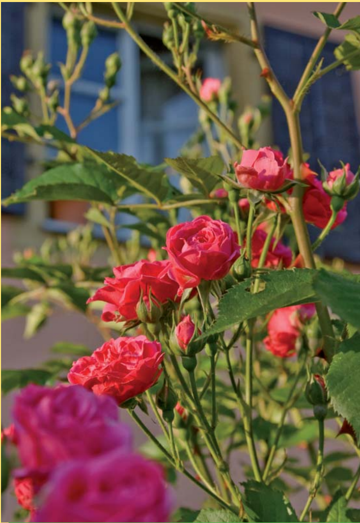
Rosen für Regensburg, die Erste: Herrlich duftende Rosen in den Gärten entlang der Donauanrainer in der Badstraße auf dem Oberen Wöhrd.