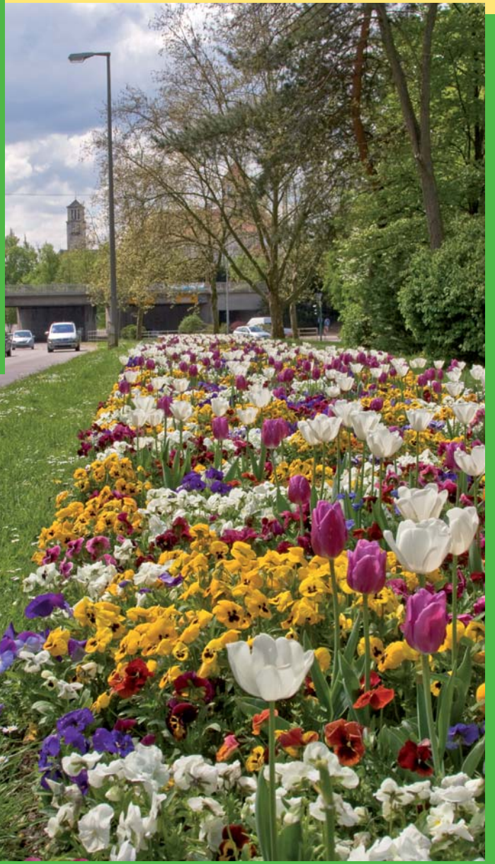
Bunter Kontrast zum Grau der Straße - blühende Inseln umflossen