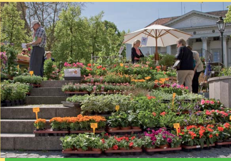
Auf dem Blumenmarkt am Bismarckplatz bekamen Hobbygärtner wertvolle Tipps für die Bepflanzung und Gestaltung von Blumenkästen, Pflanztrögen und Kräuterbeeten...