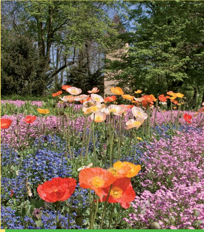
Berausches Entree Regensburgs im Frühling: Mohnblüten in einem Meer aus Vergissmeinnicht und trotzdem werden einem