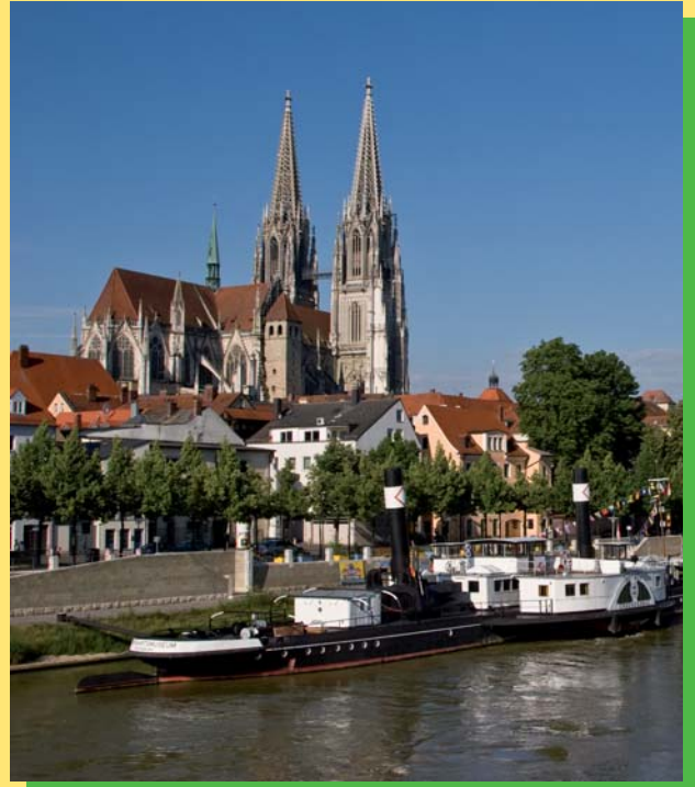
Regensburg am Morgen, die Stadt erwacht und blüht auf