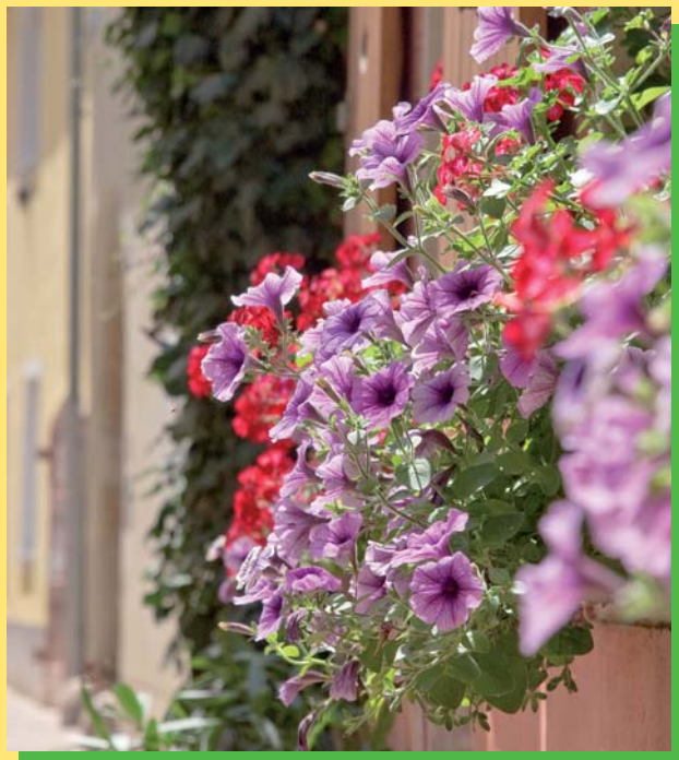
Selbst auf der kleinsten Fensterbank in den Altstadtgassen Regensburgs findet sich Platz für ein herrliches