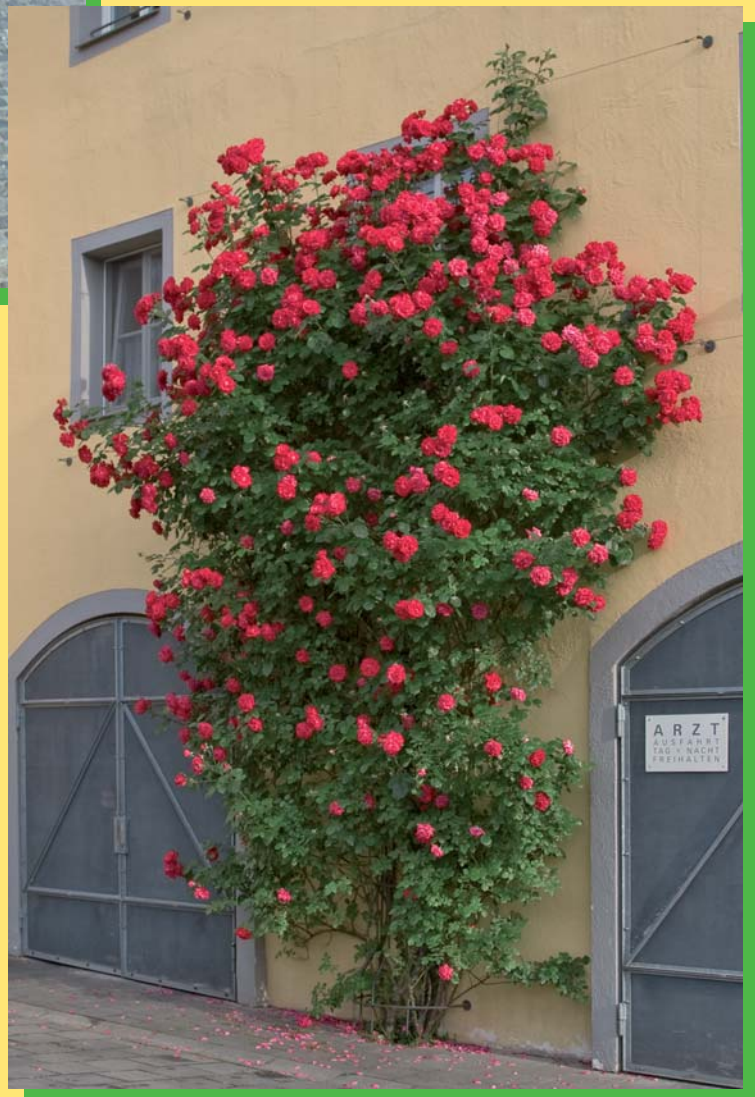
Rosen für die Altstadt, die Zweite: Wie viel Herzblut hat wohl diese Rosen so schön rot gefärbt. Ein gelungenes Beispiel für die Begrünung einer Hausfassade an der Weinlände.