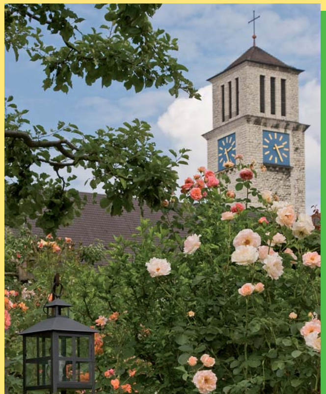
Die Stadtpfarrkirche St. Anton aus der Kleingartenanlage Rosenhain gesehen. Liebevoller Pflege der Hobbygärtner bringt traumhafte Blüten hervor.