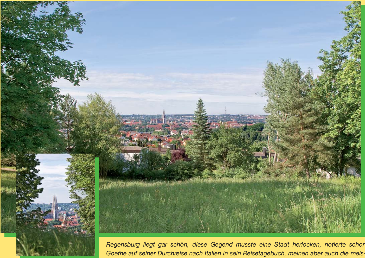
Regensburg liegt gar schön, diese Gegend musste eine Stadt herlocken, notierte schon Goethe auf seiner Durchreise nach Italien in sein Reisetagebuch, meinen aber auch die meisten anderen Besucher Regensburgs heute noch, und haben damit völlig Recht.