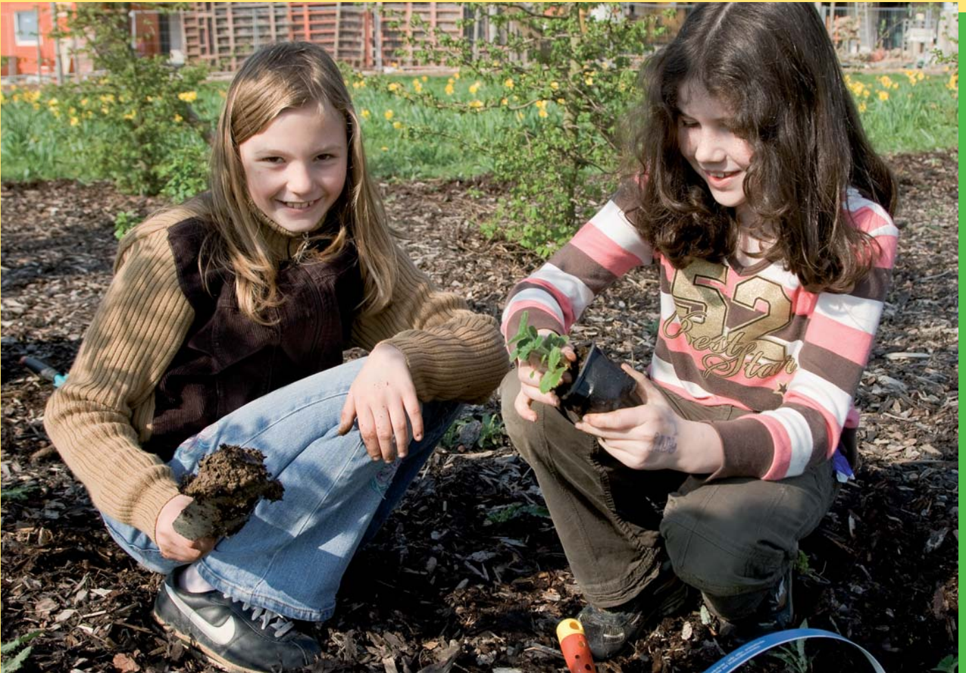
So macht die Schule Spaß. Rausgehen in die Natur, etwas erleben und gleichzeitig lernen beim Erdbeerpflanzen.