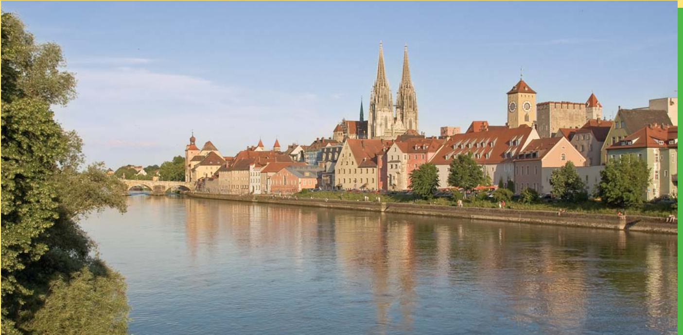
Regensburg - die mittelalterliche Perle an der Donau - präsentiert sich als blühende Metropole mit italienischem Flair.