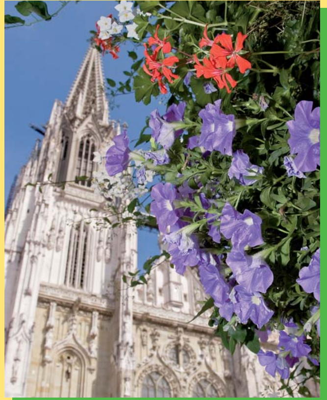
Es ist nur eine Frage der Sichtweise. Die Bepflanzung des Brunnens am Krauterermarkt bildet den Vordergrund für