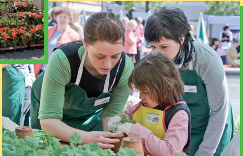
...und die Kinder konnten ihre Blumen selbst einpflanzen und gleich mit nach Hause nehmen.