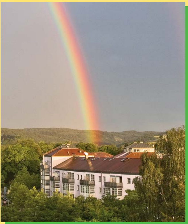
Der Volksmund behauptet, wo der Regenbogen seinen Ursprung habe, liege ein Schatz verborgen. Mitten in der Stadt und doch im Grünen eingebettet, liegt der Rennplatz, ein städtebauliches Juwel.