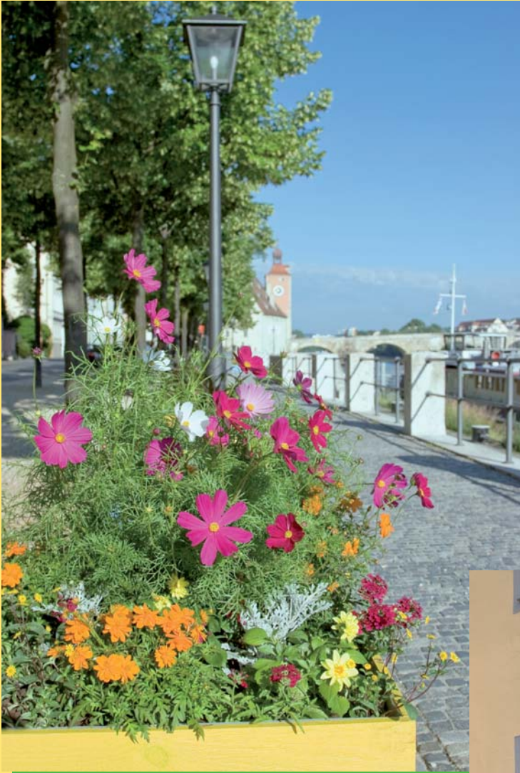
Flanieren zwischen Donau und blühenden Kostbarkeiten, vom Salzstadel bis zum Donaumarkt.