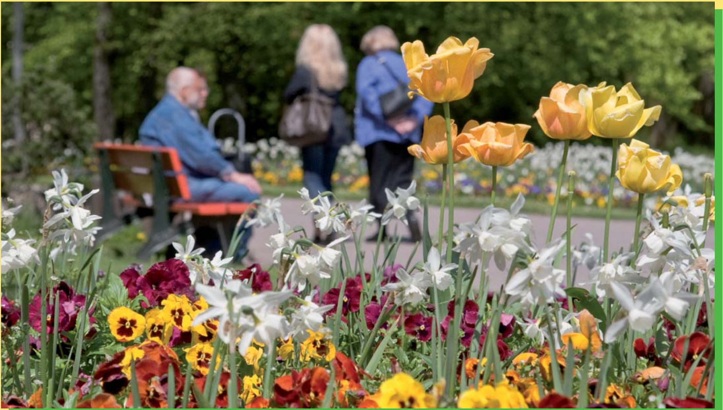
Fast schon selbstverständlich für Tausende auf ihrem Weg vom und zum Bahnhof: Das Blütenmeer zwischen Bahnhof und Altstadt