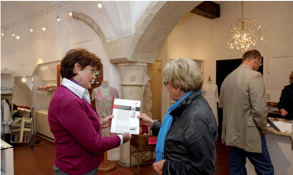
Eindrücke vom Welterbetag 2009 „Handel und Austausch“

Nachfrage stieß, beschloss die Stadtverwaltung gemeinsam mit interessierten Geschäftsleuten, diese fortzuführen. Bei der Weiterentwicklung der „Steckbriefe“ wurden die Einzelhändler mit ihren Wünschen und Vorstellungen aktiv eingebunden. Für eine angemessene professionelle Umsetzung sorgte unter anderem ein Grafikbüro.