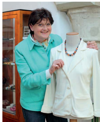
Purpur Watmarkt 4

„Es hat einen ganz besonderen Reiz, sich in einer so außergewöhnlichen Atmosphäre unter frühgotischem Kreuzgewölbe neu einzukleiden. Ein wunderbarer Rahmen für unser exklusives Sortiment an Damenmode: für die hochwertigen Textilien, die edle Strickmode, die modischen Accessoires und mehr.“