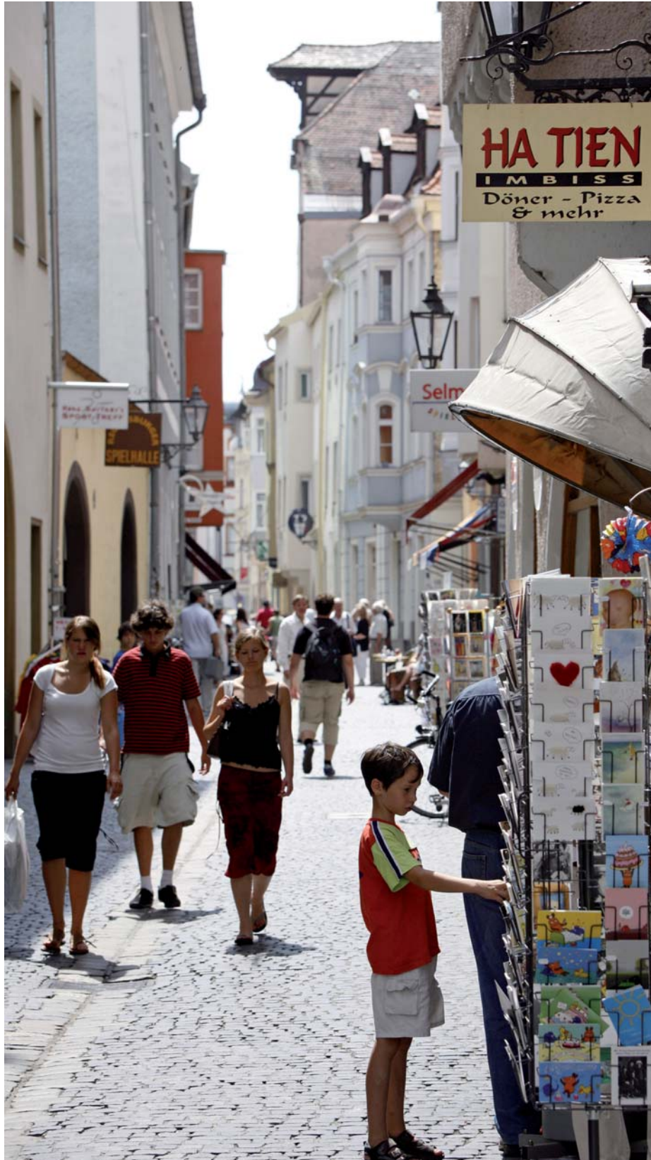
Blick in die Untere Bachgasse