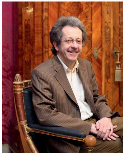
Antiquitäten Baumann Kramgasse 6

Die Sonderausstellung wird bis Ende Oktober 2011 gezeigt. Das Besucherzentrum ist täglich von 10 bis 19 Uhr geöffnet, der Eintritt ist frei.