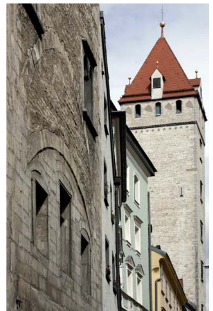
Eindrücke der an der Aktion teilnehmenden Betriebe, Eindrücke von Regensburg