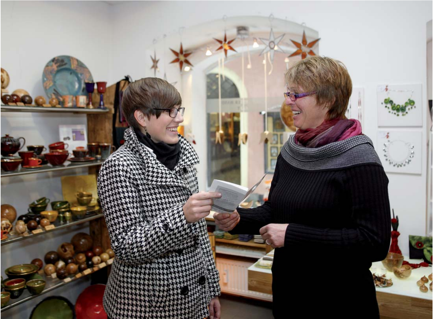
Der neue Steckbrief wird einer Kundin gezeigt