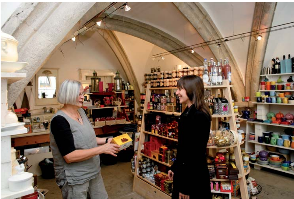
Einkaufen in historischen Gebäuden

Auch heute noch ist die zentrale und lebendige Altstadt ein beliebtes Einkaufsziel mit einer herausragenden Bedeutung für die Stadt und ihr Umland. Rund 600 Betriebe mit einer Verkaufsfläche von mehr als 78 000 Quadratmetern machen die Altstadt zu einem einmaligen Einkaufserlebnis. Dabei heben sich die Läden in der Regensburger Altstadt selbst in den Hauptgeschäftslagen deutlich vom gewohnten Muster deutscher Innenstädte ab. Neben den nationalen und internationalen Unternehmen tummeln sich hier eine Vielzahl an regionalen Filialisten, traditionellen Familienbetrieben und ein besonders großer Anteil von interessanten Klein- und Kleinstbetrieben. Diese Einzelhandelsszene bietet eine in Deutschland nur mehr selten anzutreffende Individualität in Bezug auf Zielgruppen, Sortimente und Konzepte – Wünsche bleiben hier selten offen.