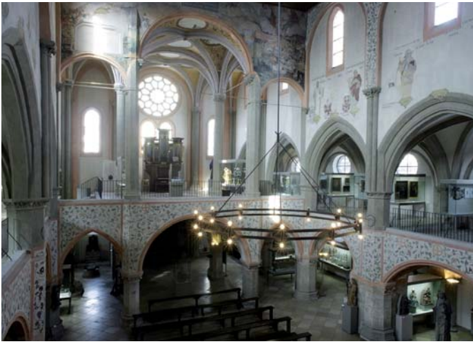
Der Blick von der Empore des Diözesanmuseums St. Ulrich nach Westen