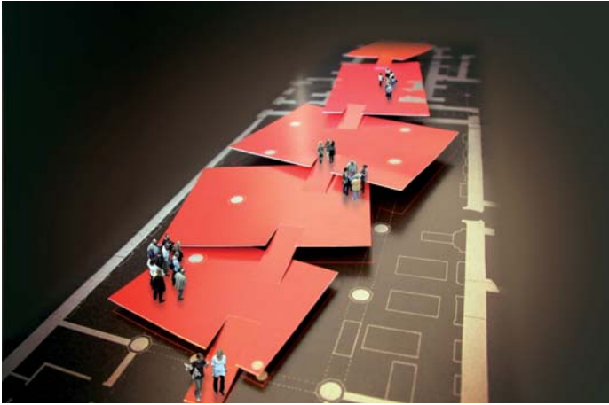
Gestaltung Minoritenkirche, © graficde'sign pürstinger, Salzburg

Die Inszenierung orientiert sich an den verschiedenen Levels eines Computerspiels. Der ansteigende Weg, den die Ausstellungsinzenierung vorgibt, führt den Besucher nach oben bis zum Ziel: zu einem schwebenden Thron, der nicht nur durch seine Größe, sondern auch mit einem Spezialeffekt beeindruckt. Ein