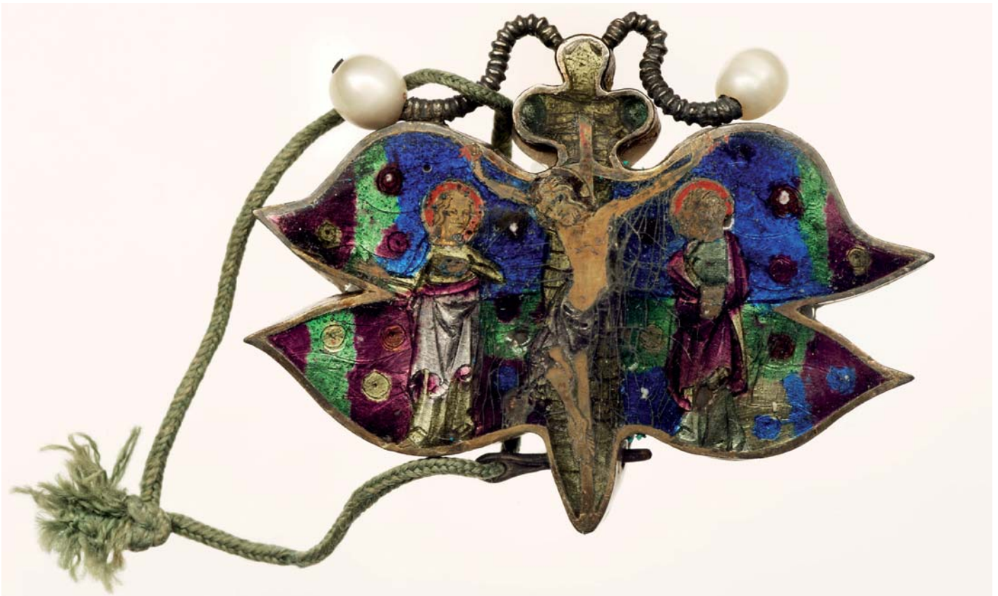
Schmetterlingsreliquiar, Paris, um 1310/1320, Silber, feuervergoldet, transluzides Emaille, Perlen, Foto: © Diözesanmuseum Regensburg, Foto: www.altrofoto.de

Für die Dreharbeiten schlüpfte der bekannte Musiker, Kabarettist und BR-Moderator Christoph Süß in verschiedene Rollen. Foto: © Elisabeth Handle-Schubert, Haus der Bayerischen Geschichte