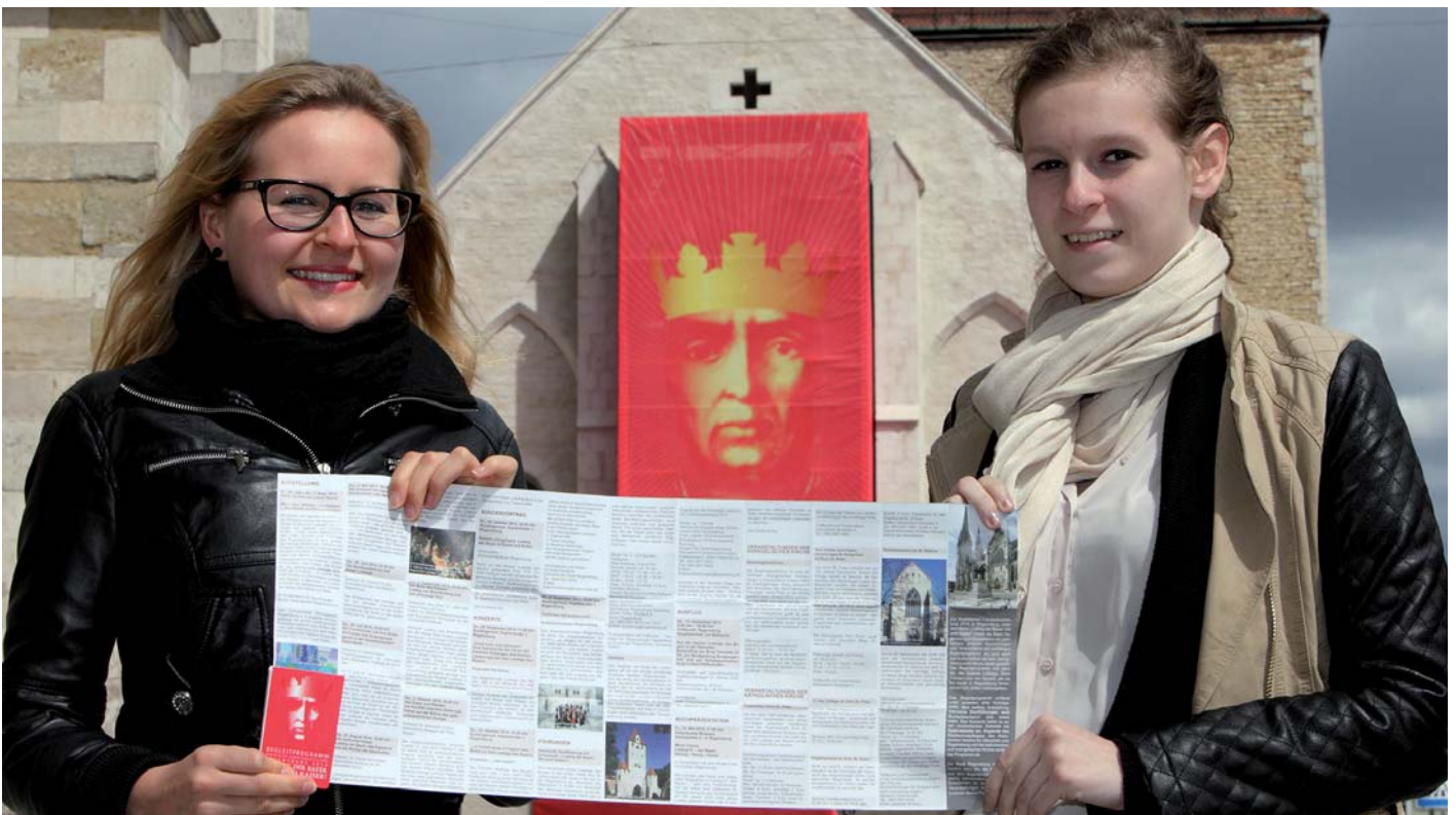
Begleitprogramm zur Landesausstellung als Faltflyer im praktischen Kreditkartenformat

Die Stadt Regensburg lädt herzlich dazu ein, die Angebote aus dem Begleitprogramm ausgiebig wahrzunehmen. Der Flyer im praktischen Kreditkartenformat verschafft einen Überblick über die vielen Programmpunkte und gibt weiterführende Informationen zu den einzelnen Veranstaltungen. Sie finden den Flyer an den drei Veranstaltungsorten der Landesausstellung (Minoritenkirche im Historischen Museum, Kirche St. Ulrich am Dom und Domkreuzgang) sowie in vielen städtischen Einrichtungen ausgelegt. Der Flyer kann auch online unter www.regensburg.de/kultur heruntergeladen werden.