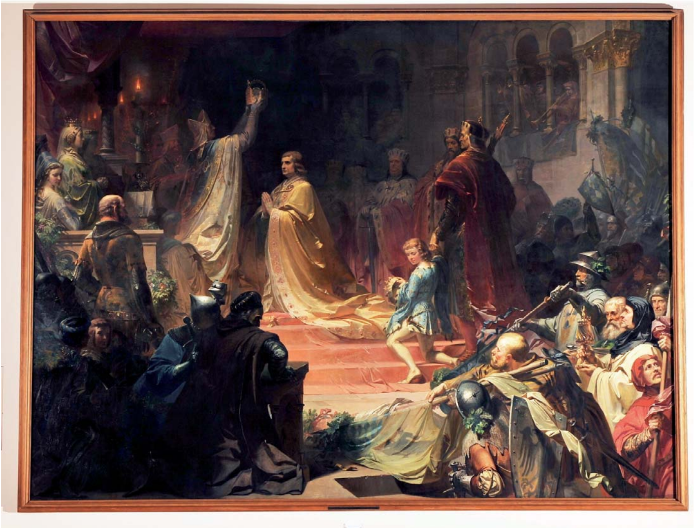
Die Kaiserkrönung Ludwigs IV. des Bayern 1328, August von Kreling (1818-1876), 1859, Öl auf Leinwand, 5,16 m x 3,78 m, Steinerne Saal, Maximilianeum, München, Leihgabe der Stiftung Maximilianeum, München, Inv.-Nr. 22

wie die konkurrierenden Dynastien der Häuser Habsburg und Luxemburg, den in Avignon residierenden Papst oder die geistlichen Kurfürsten zu behaupten, setzte Ludwig oft auf bisher nicht oder nicht in diesem Umfang genutzte Mittel. So förderte er das sich in dieser Zeit herausbildende Kaufherrenpatriziat und privilegierte Handel und Handelswege, um verstärkt Geldmittel für seine Politik zu erhalten. Er nutzte die Gegnerschaft der radikalen Minoriten gegen den Papst, um in seinem Konflikt mit Avignon auch theologisch und juristisch gewappnet zu sein. Das Doppelkönigtum mit Friedrich dem Schönen, die zunächst papstlose Kaiserkrönung in bewusster Anknüpfung an den Glanz des antiken Rom und die Umsetzung einer säkularen Kaiseridee waren radikal neue Legitimationsstrategien, die neue Wege für das spätmittelalterliche Königtum im Reich wiesen. Neu war auch das Miteinander der vielen Machtzentren – statt auf Befehl und Gehorsam gegenüber einem starken König (so in Frankreich) setzte Ludwig auf Konsens und gemeinsame Herrschaft vieler Ebenen, vom Kaiser über die