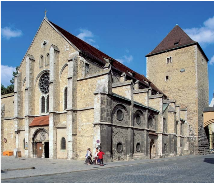
Diözesanmuseum St. Ulrich

möglicht so einen Film, der Architektur und Bildwelten zu einem Gesamtkunstwerk vereint. Die Hauptrollen darin spielt Kabarettist und BR-Moderator Christoph Süß.