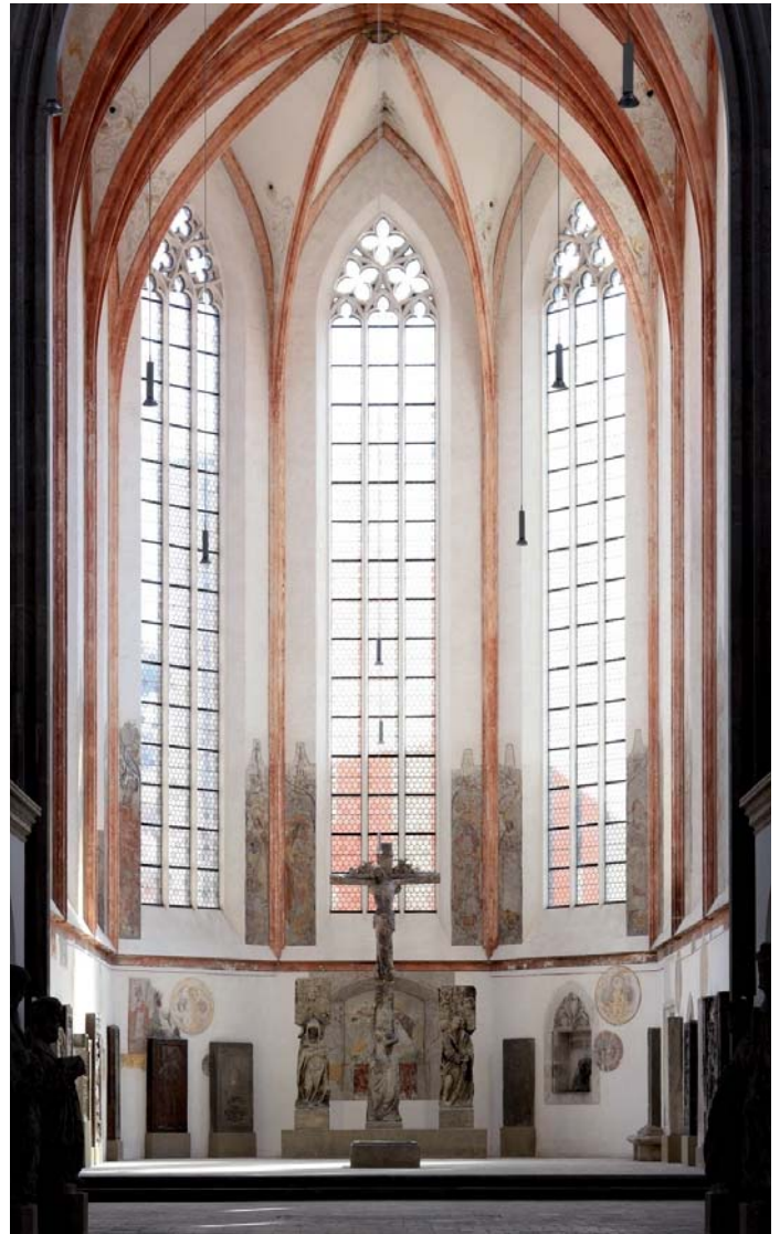
Chor Minoritenkirche, Foto: Stadt Regensburg, Peter Ferstl

Nationalmuseum München erhalten. Der Fries der 14 Nothelfer im südlichen Seitenschiff (um 1320) gilt als frühes Beispiel der Gattung Andachtsbilder.