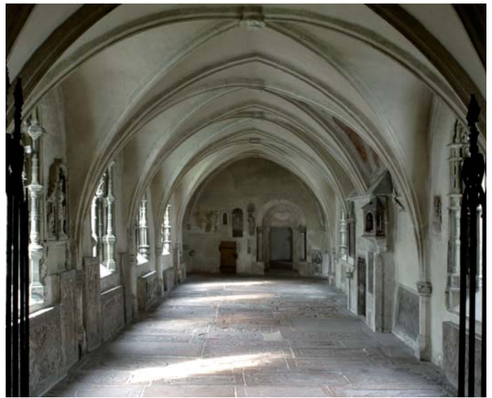
Blick in den Kreuzgang mit Mortuarium

Der Kirchenbann, den die Päpste mehrfach über Ludwig den Bayern und sein gesamtes Reich ausgesprochen hatten, bedeutete eine Zeit religiösen Aufbruchs und tiefster Verunsicherung. Der liturgische Jahreslauf war empfindlich gestört oder gar nicht mehr möglich. Auf der Suche nach Halt und Zuversicht entwickelten sich auch neue, private Andachtsformen. Der bisher nur im Rahmen von Führungen zugängliche Kreuzgang, in dem die Jenseitsvorstellungen und Frömmigkeitsformen des Mittelalters thematisiert werden, bietet die Möglichkeit zu Ruhe und Kontemplation.