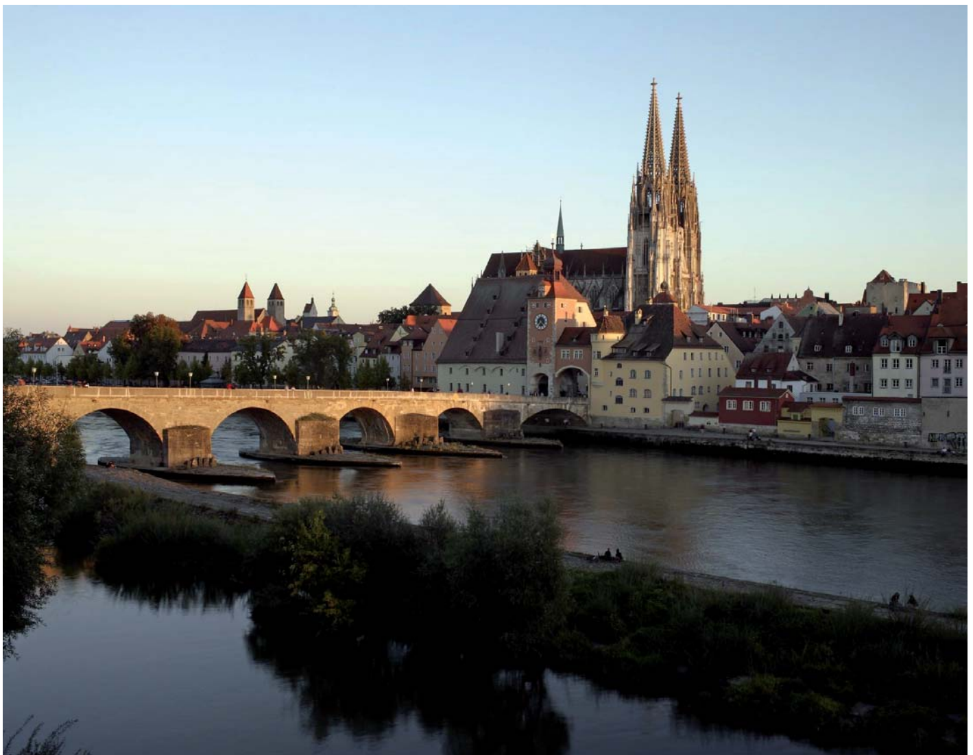
Die Steinernen Brücke über die Donau und die Regensburger Altstadt-Silhouette, Foto: © www.altfoto.de

An originalen historischen Schauplätzen Regensburgs erzählt die Ausstellung die Geschichte des bayerischen Herzogs, deutschen Königs und römischen Kaisers, mit dem Bayern zum Mittelpunkt Europas wurde. Neben den drei Ausstellungsschauplätzen wird die Stadt Regensburg als Ganzes den Rahmen bilden: Führungen durch den Dom St. Peter und eine eigens entwickelte Audioguide-Führung erschließen Orte in der Altstadt des UNESCO-Weltkulturerbes, die direkt mit der Geschichte Ludwigs des Bayern verbunden sind.