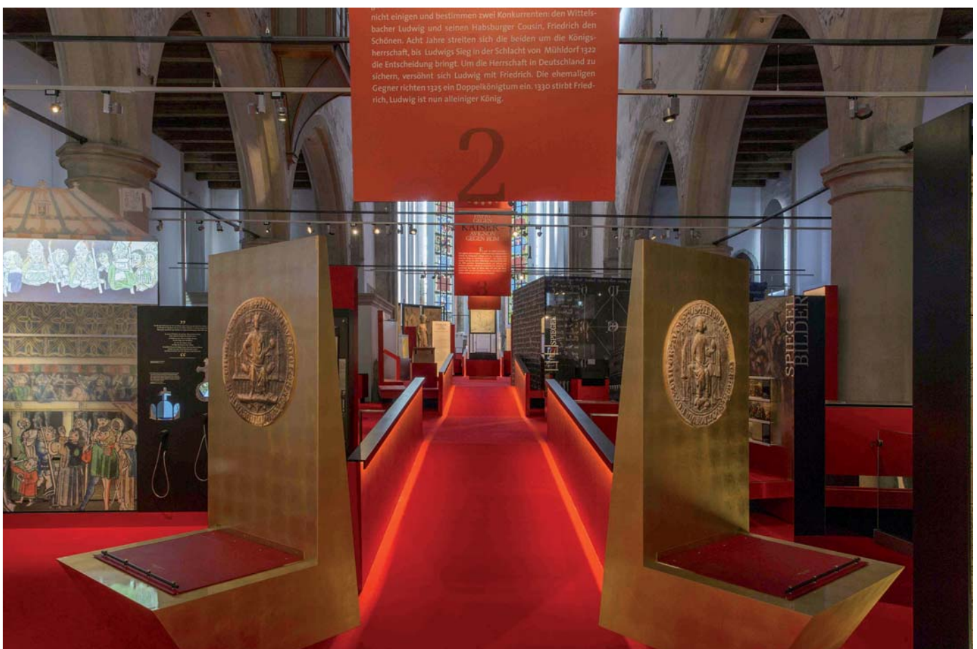
Impression Landesausstellung

Die Ausstellung verfolgt mit kulturhistorischem Blickwinkel die Umbrüche in den Jahrzehnten von etwa 1300 bis etwa 1350 – bis hin zu den großen Pestwellen von 1348/49, die gewissermaßen ein Zeitalter abschlossen. Dabei werden die Klischees hinterfragt, die über Ludwig den Bayern in Umlauf sind. Die Ausstellung entwirft ein Panorama der Zeit in ihrem politischen, wirtschaftlichen und kulturellen Wandel. Betrachtet man die Zeitspanne von immerhin 45 Jahren (1302 bis 1347), in denen Ludwig auf verschiedenen Ebenen Herrschaft ausübte, so zeigt sich eine Konstante: Um sich gegen unterschiedlichste Gegenkräfte,