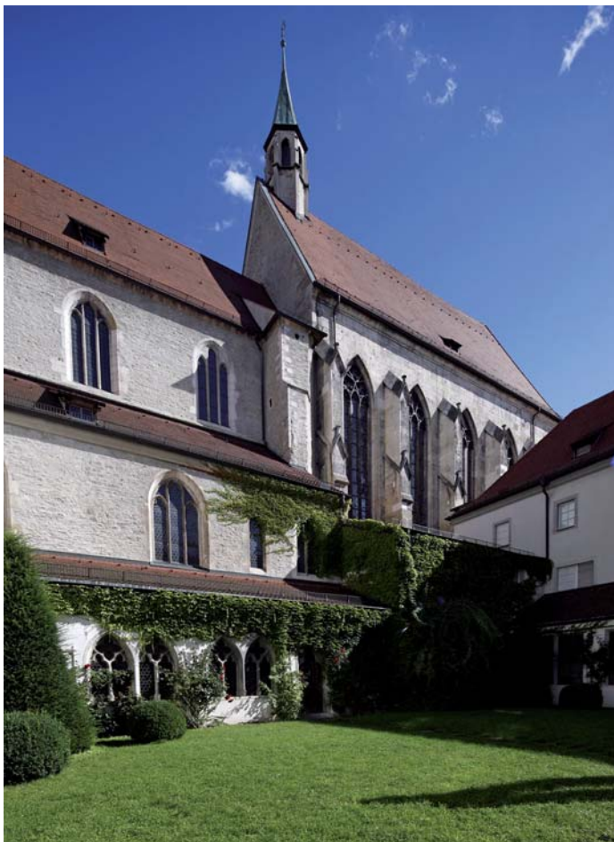
Minoritenkirche außen, mit Garten

Der hoch aufragende Bau der Minoritenkirche mit dem anschließenden Kreuzgang ist der richtige Ort, um die politische Geschichte jenes Kaisers zu erzählen, der die bedeutendsten Köpfe des Minoritenordens an seinen Hof holte – eine Geschichte, die wohl viele Besucher in Teilen aus Umberto Ecos Roman „Der Name der Rose“ kennen. Die Kirche der seit 1221 in Regensburg ansässigen Minoriten wurde in der zweiten Hälfte des 13. Jahrhunderts erbaut. Sie zählt neben der Regensburger Dominikanerkirche zu den größten Bettelordenskirchen Süddeutschlands. Zur Zeit Ludwigs des Bayern wurde der Chor neu errichtet (denochronologisch datiert auf 1347). Von der farbenprächtigen Chorverglasung sind heute Reste in den Museen der Stadt Regensburg und im Bayerischen